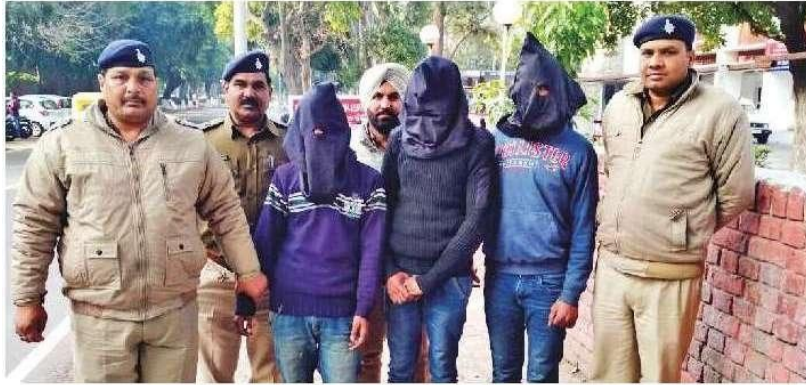
Arrested accused in police custody.